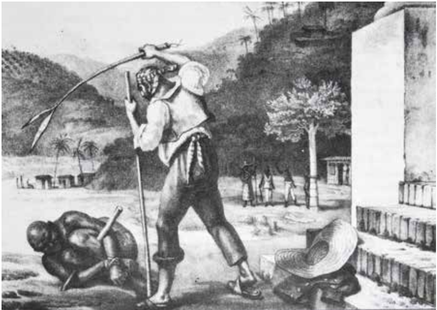
Jean-Baptiste Debret, Feitor castigando negros (Prancha 2 25).