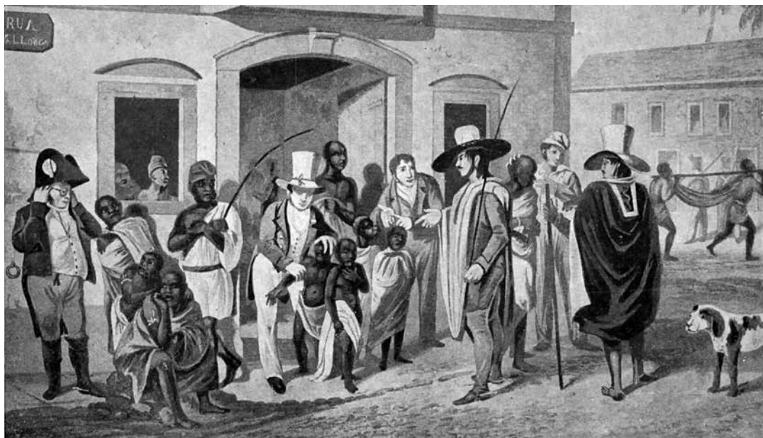
Gravura de Augustus Earle, O mercado do Valongo (Graham, 1824).

esta bola de carne negra, entrevado, sem poder se mexer sob os golpes do feitor, que é causa do horror. É ele que transmite uma atitude que horroriza quem a vê, quando na realidade é a sua situação, ou a violência dos golpes, que horroriza, violência que podemos bem imaginar, visto o impulso que toma o braço do feitor. Esta inversão desloca o sentimento de horror do carrasco para o sofrimento da vítima.